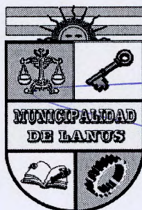
ACT. NESTOR OSVALDO GRINETTI INTENDENTE MUNICIPAL