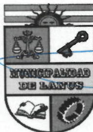
ACT. NESTOR OSVALDO GRINETTI INTENDENTE MUNICIPAL