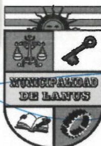
ACT. NESTOR OSVALDO GRINETTI INTENDENTE MUNICIPAL