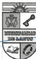
NESTOR OSVALDO GRINDETTI Intendente Municipal