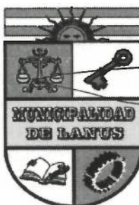
ACT. NESTOR OSVALDO GRINETTI INTENDENTE MUNICIPAL