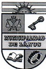
NESTOR OSVALDO GRINETTI INTENDENTE MUNICIPAL