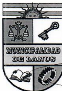
NESTOR OSVALDO GRINETTI INTENDENTE MUNICIPAL