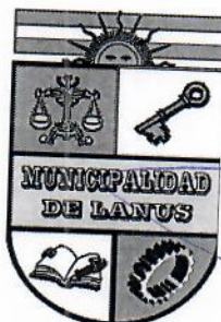
NESTOR OSVALDO GRINETTI INTENDENTE MUNICIPAL