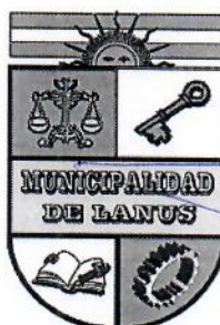
NESTOR OSVALDO GRINETTI INTENDENTE MUNICIPAL