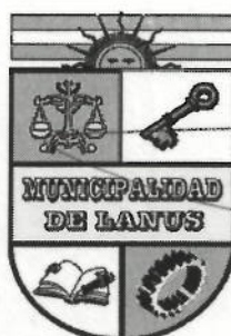
ACT. NESTOR OSVALDO GRINETTI INTENDENTE MUNICIPAL