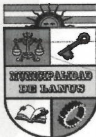
ACT. NESTOR OSVALDO GRINETTI INTENDENTE MUNICIPAL