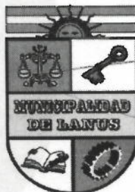
ACT. NESTOR OSVALDO GRINETTI INTENDENTE MUNICIPAL