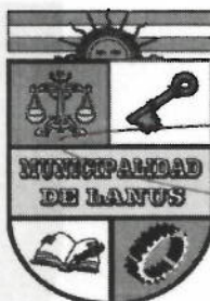
ACT. NESTOR OSVALDO GRINETTI INTENDENTE MUNICIPAL