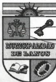
ACT. NESTOR OSVALDO GRINETTI INTENDENTE MUNICIPAL