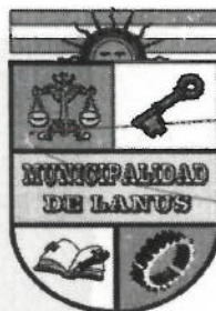
ACT. NESTOR OSVALDO GRINETTI INTENDENTE MUNICIPAL