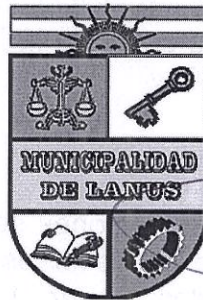
NESTOR OSVALDO GRINETTI INTENDENTE MUNICIPAL