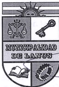
NESTOR OSVALDO GRINETTI INTENDENTE MUNICIPAL