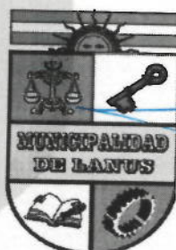
ACT. NESTOR OSVALDO GRINETTI INTENDENTE MUNICIPAL