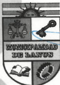
ACT. NESTOR OSVALDO GRINETTI INTENDENTE MUNICIPAL