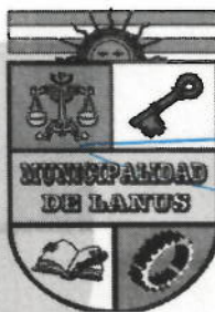
ACT. NESTOR OSVALDO GRINETTI INTENDENTE MUNICIPAL