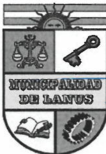
ACT. NESTOR OSVALDO GRINETTI INTENDENTE MUNICIPAL