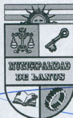
NESTOR OSVALDO GRINETT Intendente Municipal