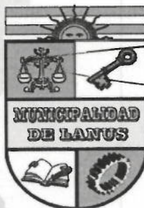
ACT. NESTOR OSVALDO GRINETTI INTENDENTE MUNICIPAL