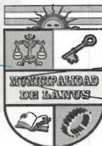
ACT. NESTOR OSVALDO GRINETTI INTENDENTE MUNICIPAL