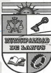
ACT. NESTOR OSVALDO GRINETTI INTENDENTE MUNICIPAL