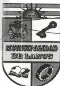
ACT. NESTOR OSVALDO GRINETTI INTENDENTE MUNICIPAL