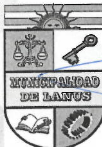
NESTOR OSVALDO GRINETTI INTENDENTE MUNICIPAL