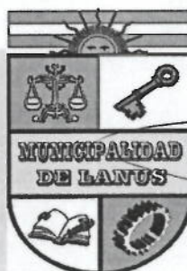
NESTOR OSVALDO GRINETTI INTENDENTE MUNICIPAL