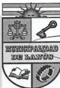
NESTOR OSVALDO GRINETTI INTENDENTE MUNICIPAL