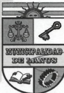
NESTOR OSVALDO GRINETTI INTENDENTE MUNICIPAL