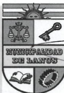
NESTOR OSVALDO GRINETTI INTENDENTE MUNICIPAL