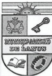
NESTOR OSVALDO GRINETTI INTENDENTE MUNICIPAL