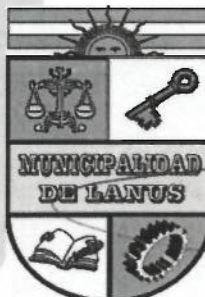
NESTOR OSVALDO GRINETTI INTENDENTE MUNICIPAL