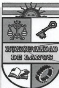
NESTOR OSVALDO GRINETTI INTENDENTE MUNICIPAL