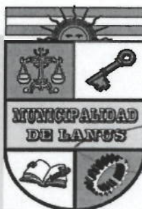
NESTOR OSVALDO GRINETTI INTENDENTE MUNICIPAL