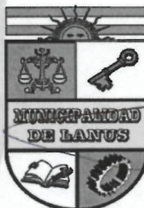
NESTOR OSVALDO GRINETTI INTENDENTE MUNICIPAL