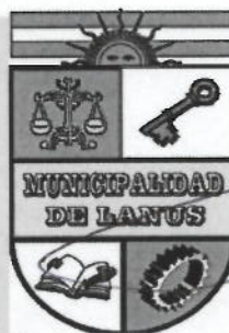
NESTOR OSVALDO GRINETTI INTENDENTE MUNICIPAL