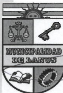
NESTOR OSVALDO GRINETTI INTENDENTE MUNICIPAL