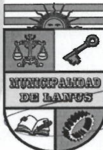
NESTOR OSVALDO GRINETTI INTENDENTE MUNICIPAL