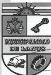
NESTOR OSVALDO GRINETTI INTENDENTE MUNICIPAL