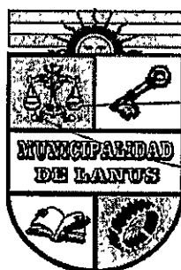
ACT. NESTOR OSVALDO GRINETTI INTENDENTE MUNICIPAL