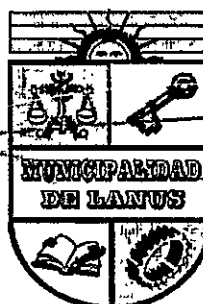
ACT. NESTOR OSVALDO GRINETTI INTENDENTE MUNICIPAL